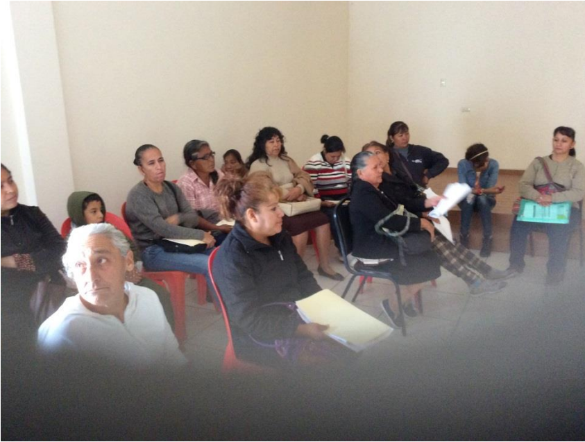
REUNIÓN DE VOCALES